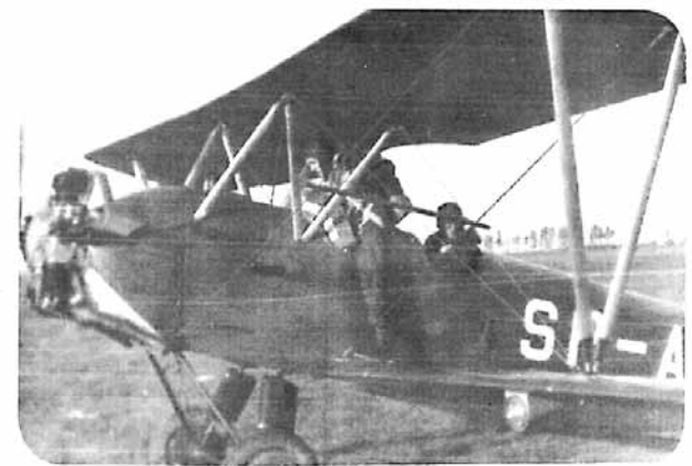
Skoczek wsiada do samolotu CSS-13.