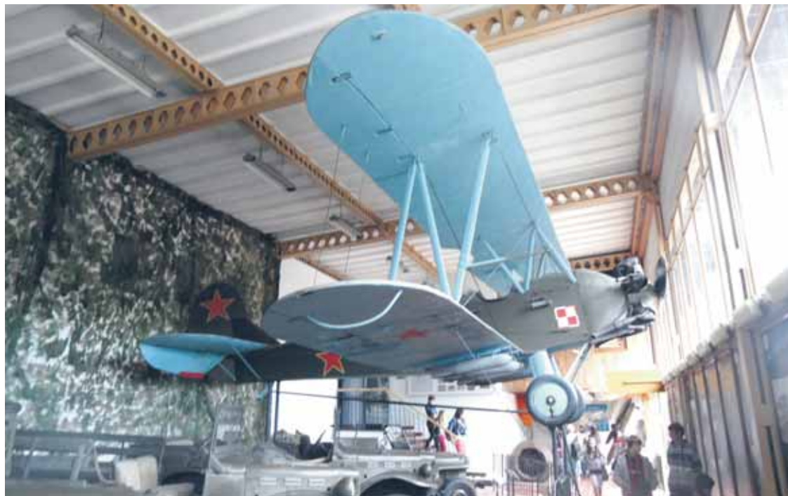
Radziecki samolot szkolno-łącznikowy Po-2 pierwovzór polskiego CSS-13 Muzeum Oręża Polskiego w Kołobrzegu