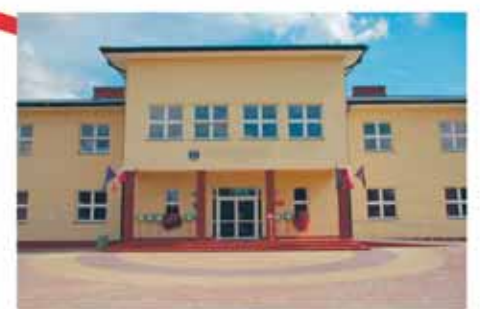
Szkoła Podstawowa w Izabelinie