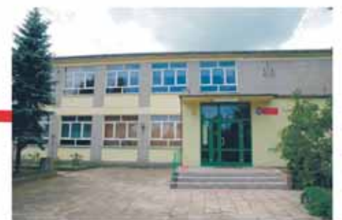
Zespół Szkolno - Przedszkolny w Wólce Radzymińskiej