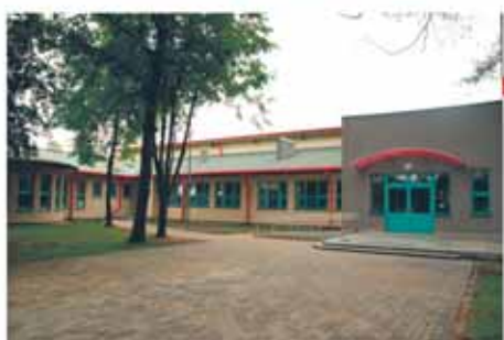
Szkoła Podstawowa w Józefowie