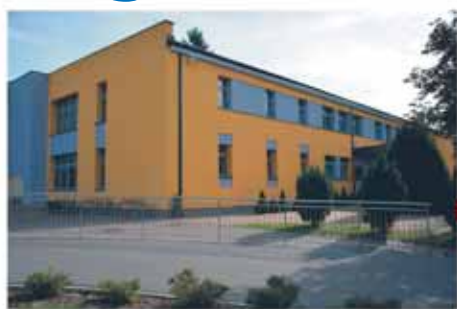
Szkoła Podstawowa w Nieporęcie