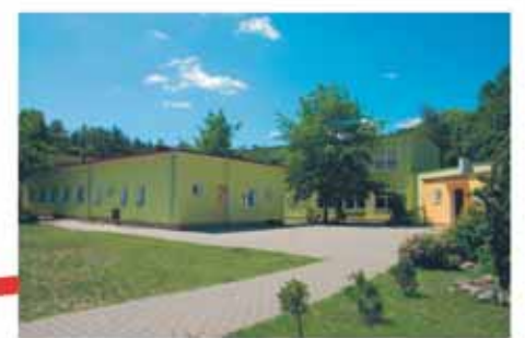
Szkoła Podstawowa w Białobrzegach