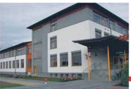
Szkoła Podstawowa w Stanisławowie Pierwszym