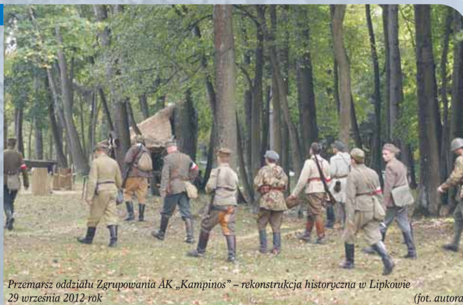
Przemarsz oddziału Zgrupowania AK „Kampinos” – rekonstrukcja historyczna w Lipkowie 29 września 2012 rok