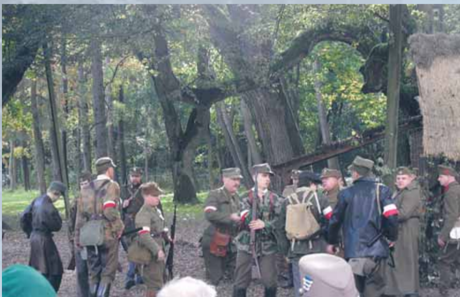
Piechota Zgrupowania AK „Kampinos” – rekonstrukcja historyczna w Lipkowie 28 września 2013 rok