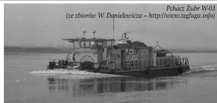
Pchacz Żubr W-03

Pchacze klasy Żubr były wyposażone w dwa silniki wysokoprężne typu B90W produkcji Puckich Zakładów Mechanicznych w Pucku, dysponując mocą 2 x 66 kW. Kadłub pchacza miał wymiary: długość L=21,0 m, szerokość B=5,8 m, zanurzenie T=0,75 m. Żubr mógł prowadzić dwie barki, a łączna długość takiego zestawu to 83 m, szerokość 8,5 m, nośność 580 t. Na stojącej wodzie zestaw pchany rozwijał prędkość 9 km/h. Długość pchacza Żubr i barek zostały dobrane z uwzględnieniem parametrów służby żeglugaowej na Żeraniu, której ko-