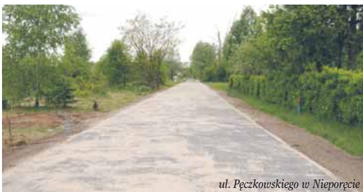
ul. Pęczkowskiego w Nieporęcie