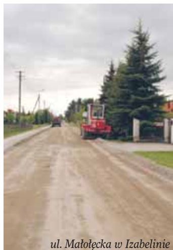
ul. Małolecka w Izabelinie