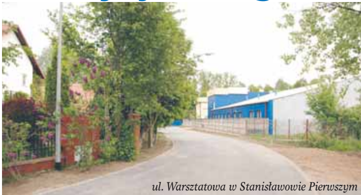
ul. Warsztatowa w Stanisławowie Pierwszym