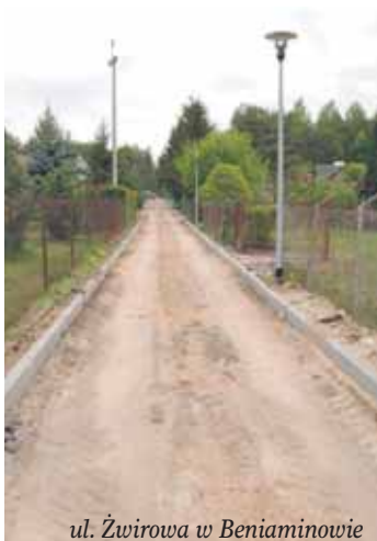
ul. Żwirowa w Beniaminowie