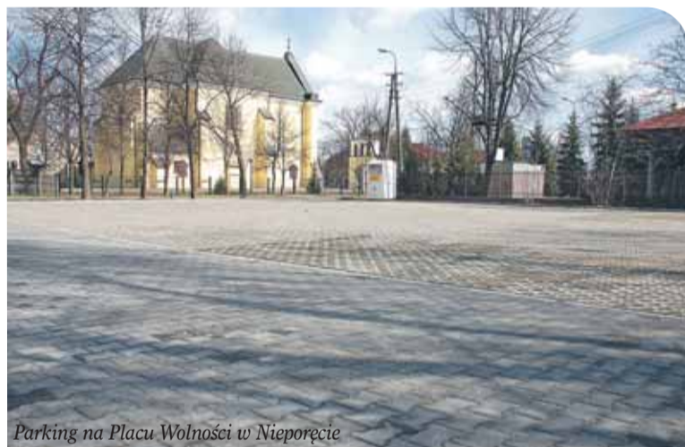
Parking na Placu Wolności w Nieporęcie

Dobiegły końca prace na ulicy Butryma na osiedlu Głogi. Firma Dromo wykonała nawierzchnię z kostki betonowej wraz z wjazdami do posesji i powierzchniowym odwodnieniem. Koszt inwestycji wyniósł 41 tys. złotych.