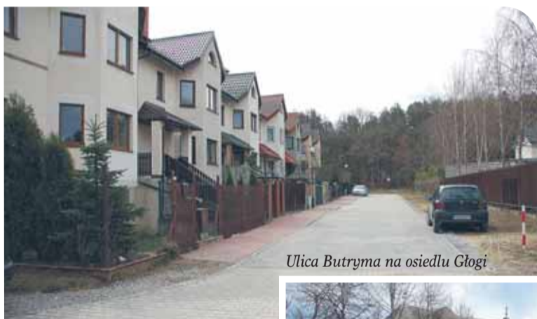
Ulica Butryma na osiedlu Głogi