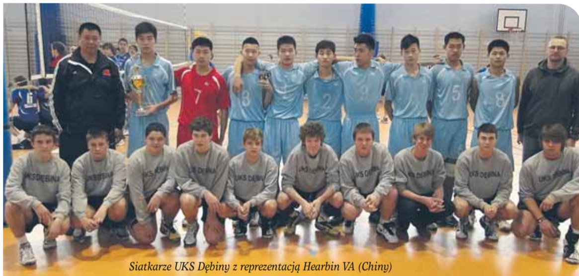
Siatkarze UKS Dębiny z reprezentacją Hearbin VA (Chiny)

Przez trzy dni osiem zespołów kadetów rywalizowało w hali Gimnazjum nr 164 na Białołęce o Puchar Burmistrza Dzielnicy Warszawa – Białołęka w ramach V Międzynarodowego Warszawskiego Turnieju Siatkówki.