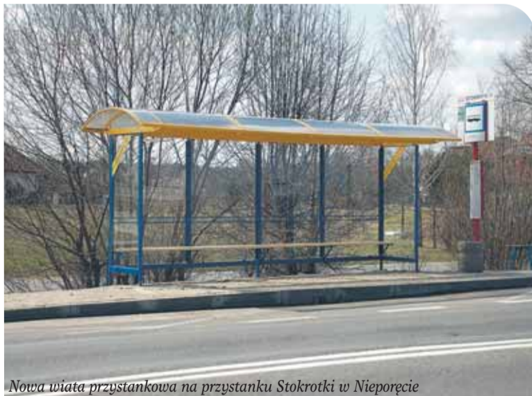
Nowa wiata przystankowa na przystanku Stokrotki w Nieporęcie

W drugim etapie prac wykonawca położył płyty eko na powierzchni ok. 300 m 2 . Powstała również droga manewrowa o pow. 150 m 2 . Koszt inwestycji wyniósł 34 305 zł.