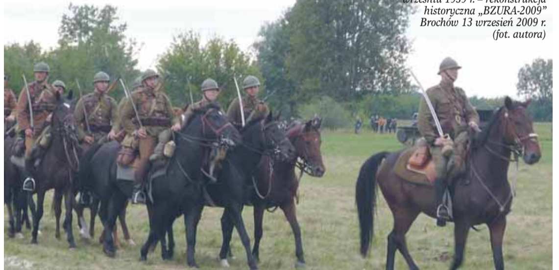
Szwadron polskiej kawalerii we wrześniu 1939 r. – rekonstrukcja historyczna „BZURA-2009” Brochów 13 września 2009 r.

Operacyjna dowodzona przez gen. bryg. WP Juliusza Zulaufa, z rozkazem bronięcia rzeki Wisły i Narwi od Zakroczyrzem po Serock. Na odcinku Zegrze – Dębe, płk. dypl. Józef Sas-Hoszowski, dowódca Warszawskiej Brygady Obrony Narodowej dysponował 1 batalionem 26 pułku piechoty, 2 batalionem Warszawskiej Brygady Obrony Narodowej „Warszawa II” oraz improwizowanym batalionem wojsk łączności z Centrum Wyszokolenia Łączności w Zegrzu mjr. Wiktora Pikulskiego. Wsparcie artyleryjskie stanowiły oddziały 78 dywizjonu artylerii lekkiej (armaty 75mm i 100mm) kpt. Ludwika Lipki. Przed wieczorem 6 września odcinek został wzmocniony 13 pociągiem pancernym (wycofany popołudniu 7 IX do dyspozycji dowódcy Armii), a w nocy z 6 na 7 września dołączył 98 dywizjon artylerii ciężkiej kpt. Edwarda Chmelika i zajął stanowiska ogniowe w rejonie Nieporętu. Nad ranem 7 września załoga przedmościa w Zegrzu wycofała się na południowy brzeg Narwi, a most w Zegrzu na rozkaz dowódcy Armii „Modlin” został wysadzony w powietrze. Opuściwszy przedmoście pod Zegrzem organizowano obronę na południowym brzegu, którą powierzono utworzonej 8 września Armii „Warszawa” (dow. gen. dyw. WP Juliusz Karol Rómmel). Zgodnie z rozkazem Naczelnego Wodza marsz. Rydza-Śmigłego Armii tej podlegały wszystkie znajdujące się na tym terenie oddziały wojskowe, z zadaniem obrony Modlina i linii Narwi od Zegrza do ujścia do Wisły. W przypadku