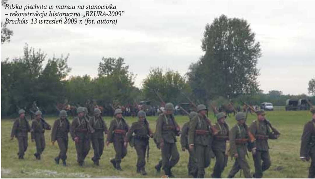
Polska piechota w marszu na stanowiska – rekonstrukcja historyczna „BZURA-2009” Brochów 13 września 2009 r.