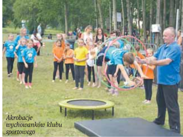
Akrobacje wychowanków klubu sportowego