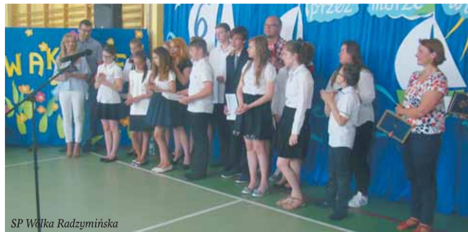
SP Wólka Radzymińska