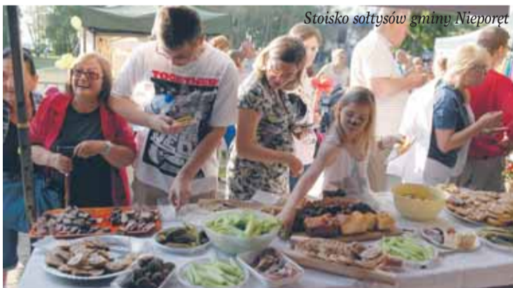
Stoisko sottysów gminy Nieporęt