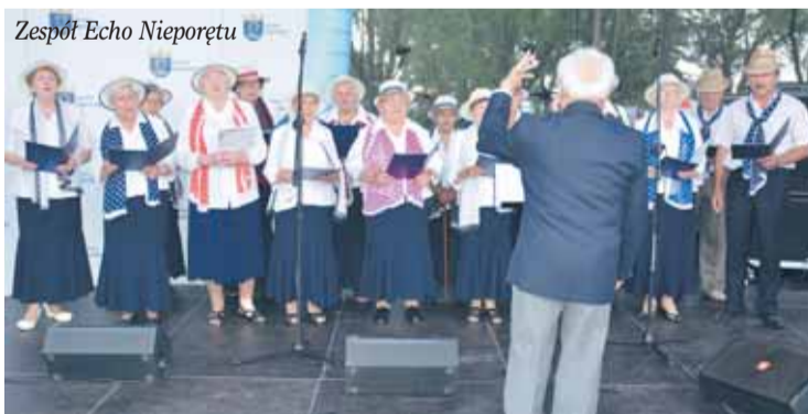
Zespół Echo Nieporętu