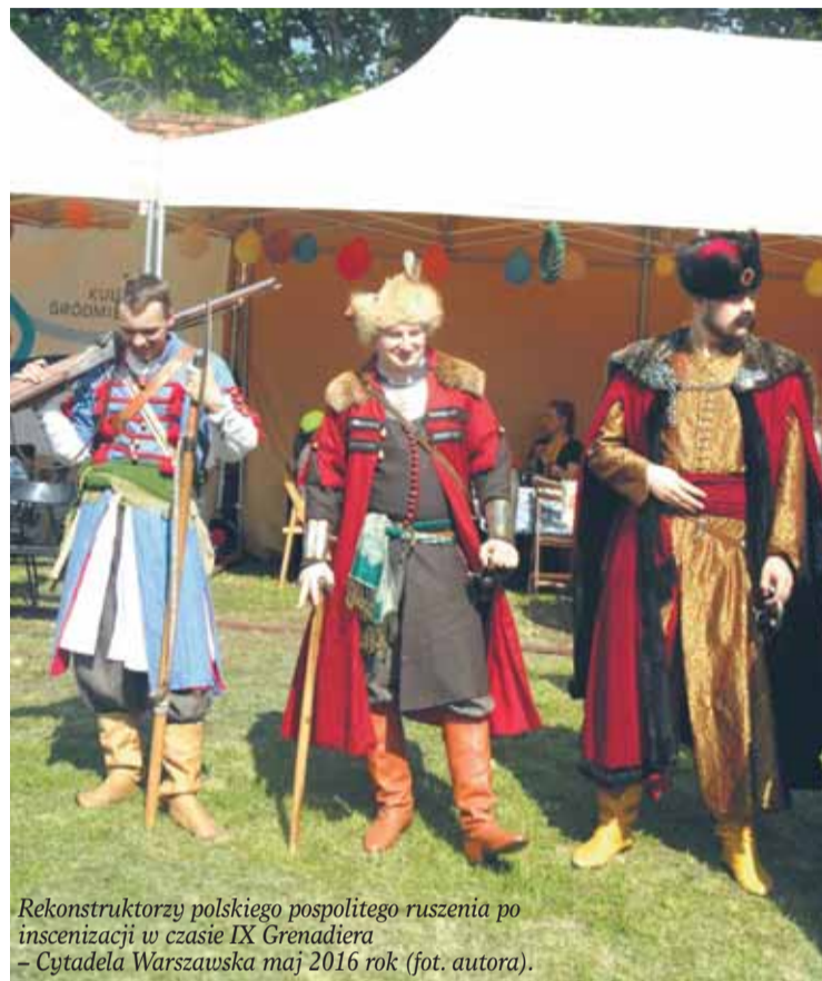
Rekonstruktorzy polskiego pospolitego ruszenia po inscenizacji w czasie IX Grenadiera - Cytadela Warszawska maj 2016 rok (fot. autora).

udało im się zająć taborów przeciwnika na Bródnie, ani rozbić tyłów wojsk szwedzkich w drugim dniu bitwy. Jednak wynikało to z ich skromnej liczebności, z obiecanych kilkudziesięciu tysięcy ordyńców pod Warszawę przybyło tylko ich ok. dwóch tysięcy. W takiej liczbie w starciu z wyborowymi oddziałami rajtarii, wspartej muszkieterami i artylerią, nie mieli szans na powodzenie. Dopiero 4 sierpnia 1656 roku po opuszczeniu Warszawy dochodzi pod Okuniewem do połączenia oddziałów królewskich z jazdą koronną i Tatarami. W czasie odwrotu z Warszawy strona polska utraciła znaczną ilość dział, które bez zaprzęgów konnych dostały się