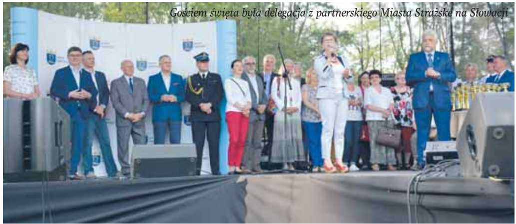
Gościem święta była delegacja z partnerskiego Miasta Strážske na Słowacji