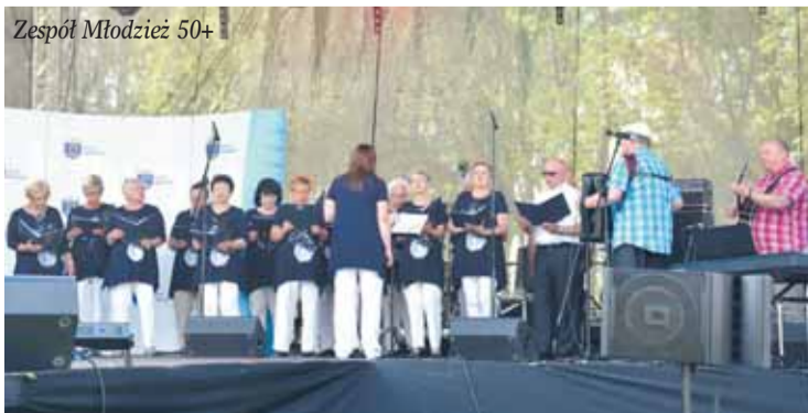
Zespół Młodzież 50+

Sportowym akcentem rozpoczęły się obchody Święta Gminy Nieporęt. Poranne zawody wędkarskie oraz turniej piłki plażowej to był dopiero początek wielu atrakcji, które wypełniły piękny świąteczny dzień.