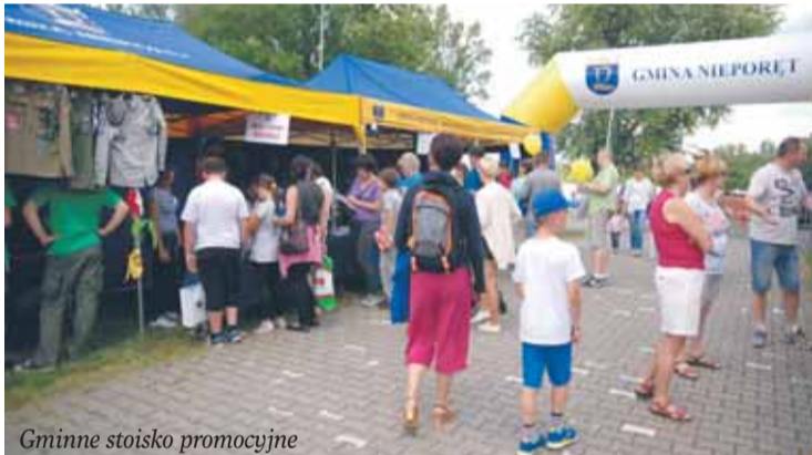
Gminne stoisko promocyjne