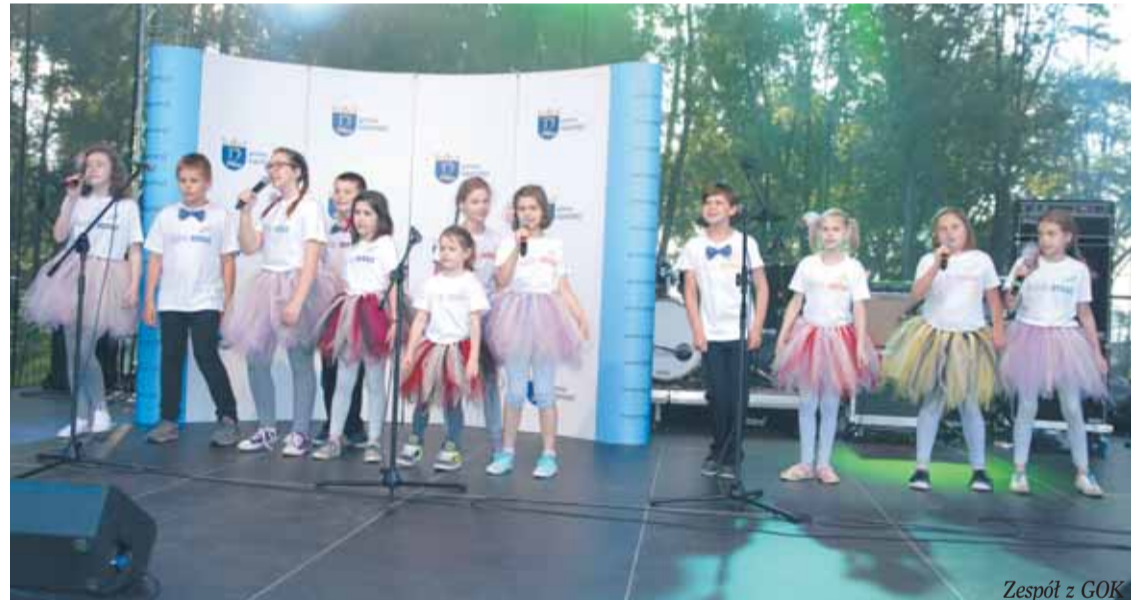
Zespół z GOK

Sportowym akcentem rozpoczęły się obchody Święta Gminy Nieporęt. Poranne zawody wędkarskie oraz turniej piłki plażowej to był dopiero początek wielu atrakcji, które wypełniły piękny świąteczny dzień.