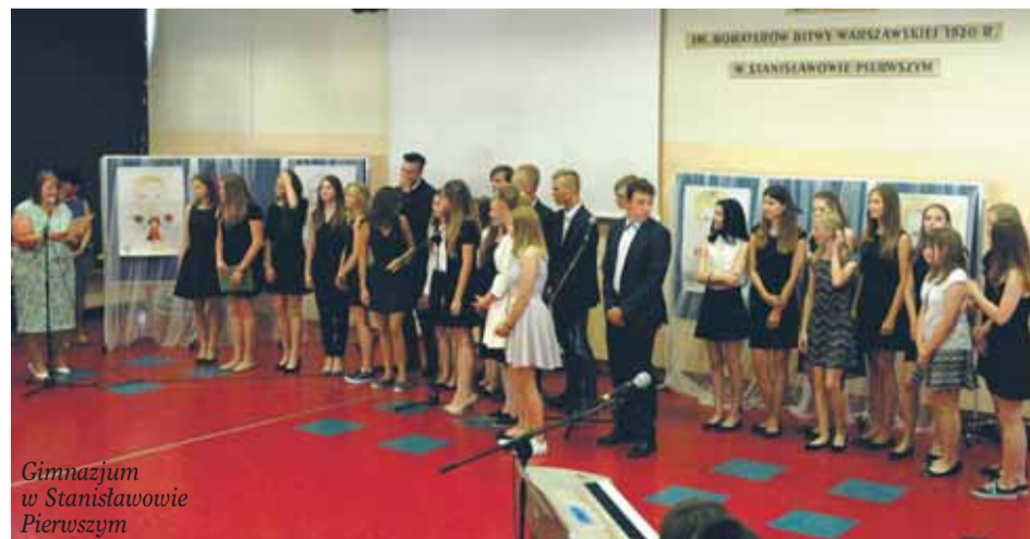
Gimnazjum w Stanisławowie Pierwszym