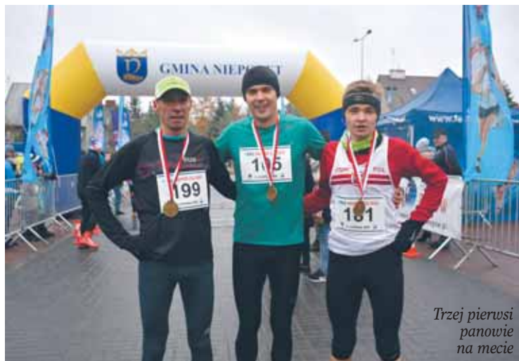
Trzej pierwsi panowie na mecie