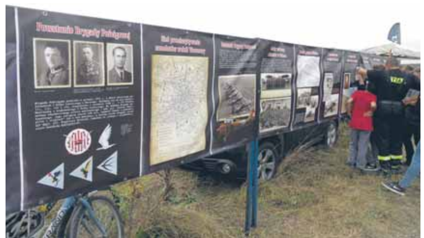
Prezentacja Fundacji Historycznej Lotnictwa Polskiego na pikniku lotniczym w Nadmie