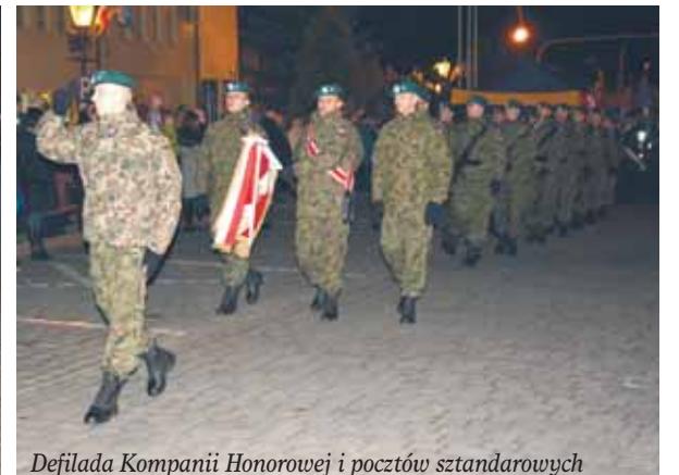
Defilada Kompanii Honorowej i pocztów sztandarowych