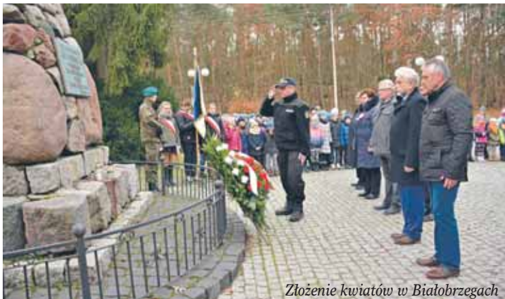
Złożenie kwiatów w Białobrzegach