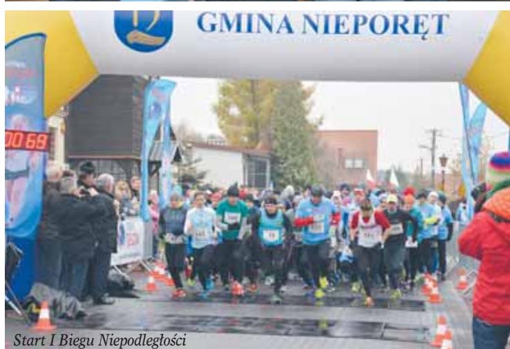
Start I Biegu Niepodległości