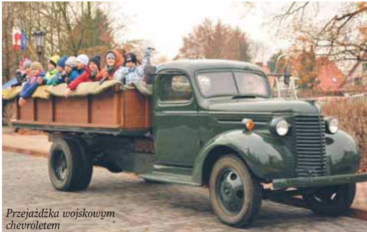
Przejażdżka wojskowym chevroletem