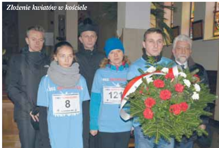
Złożenie kwiatów w kościele