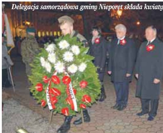
Delegacja samorządowa gminy Nieporęt składa kwiaty