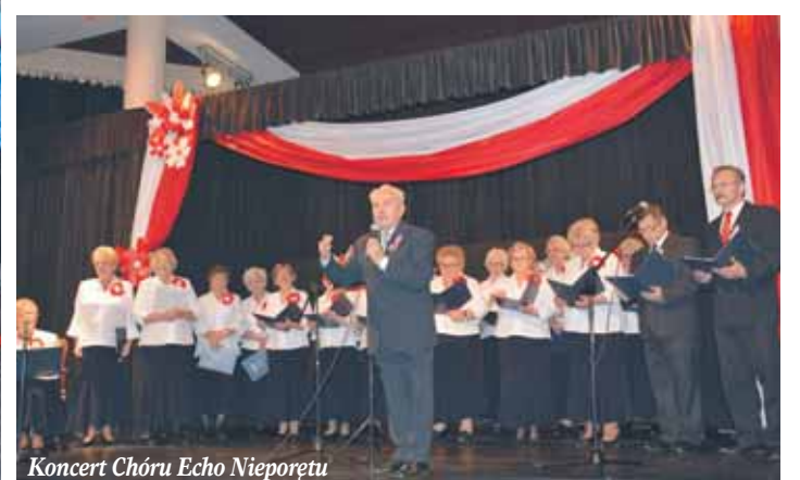
Koncert Chóru Echo Nieporętu