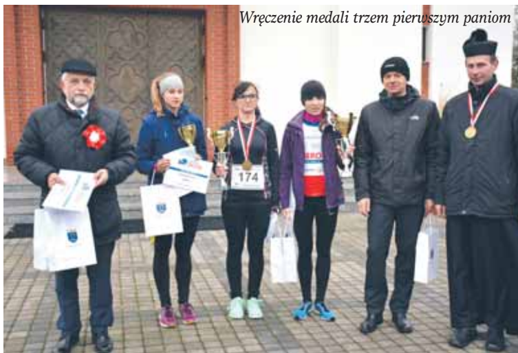
Wręczenie medali trzem pierwszym paniom

Po tak udanym debiucie organizatorzy zapraszają do udziału w przyszłorocznym Biegu Niepodległości. To doskonała alternatywa dla świętowania przed telewizorem, gwarantująca dużo więcej wrażeń. □ BW