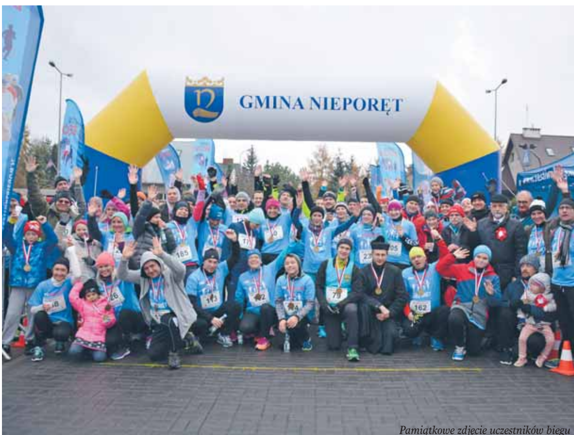
Pamiątkowe zdjęcie uczestników biegu