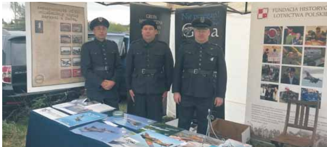
Stoisko Fundacji Historycznej Lotnictwa Polskiego na pikniku lotniczym w Nadmie