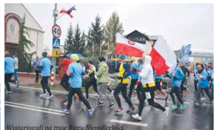
Wystartowali na trasę Biegu Niepodległości