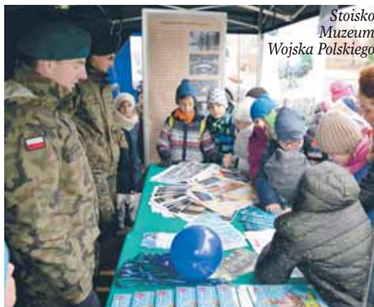
Stoisko Muzeum Wojska Polskiego