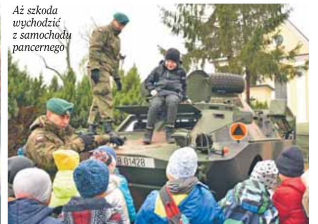
Aż szkoda wychodzić z samochodu pancernego