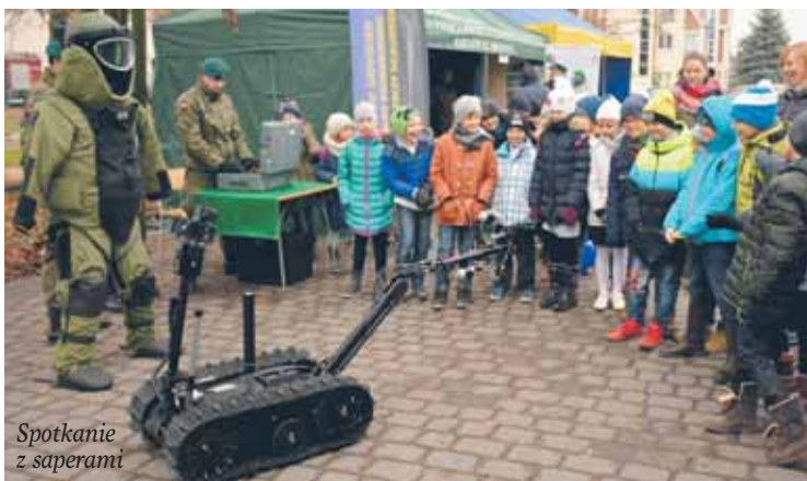
Spotkanie z saperami