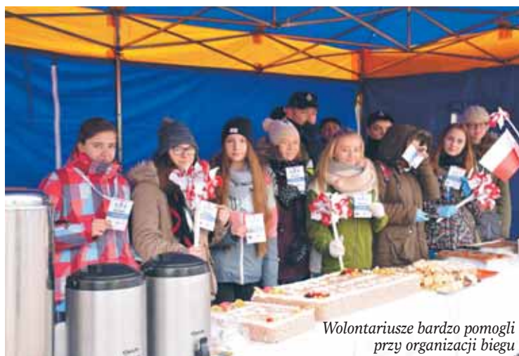
Wolontariusze bardzo pomogli przy organizacji biegu