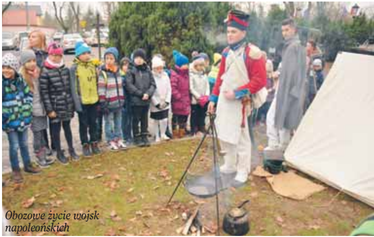
Obozowe życie wojsk napoleońskich