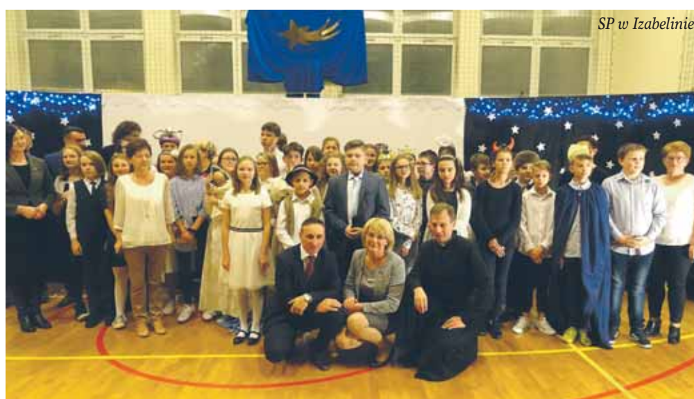
SP w Izabelinie