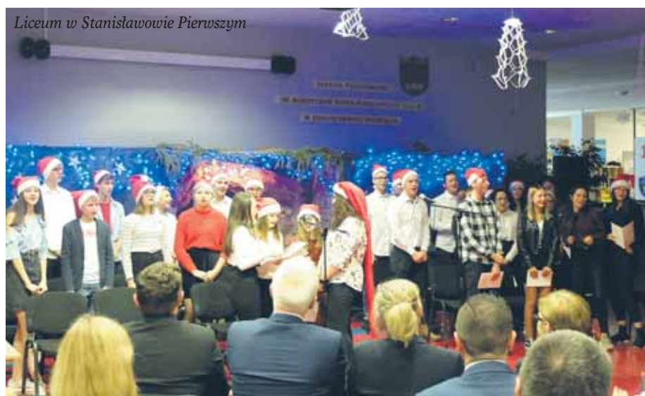
Liceum w Stanisławowie Pierwszym