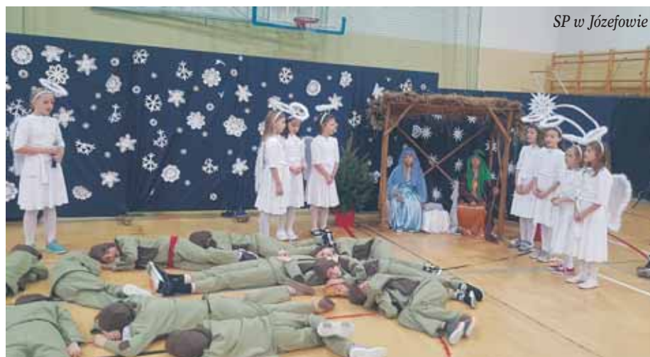
SP w Józefowie