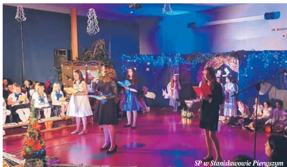
SP w Stanisławowie Pierwszym