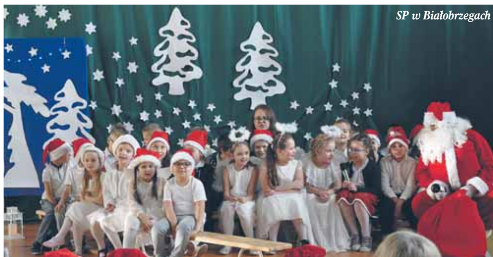
SP w Białobrzegach