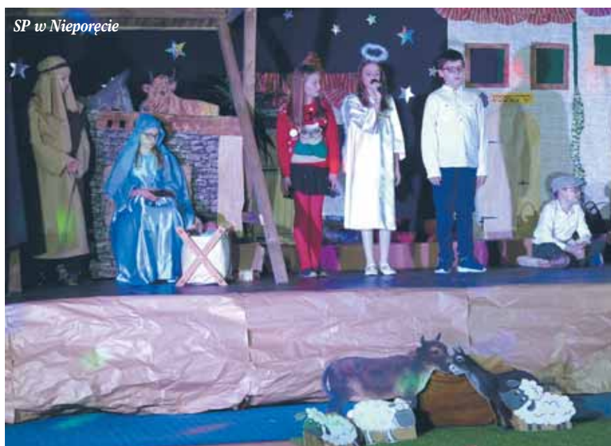
SP w Nieporęcie