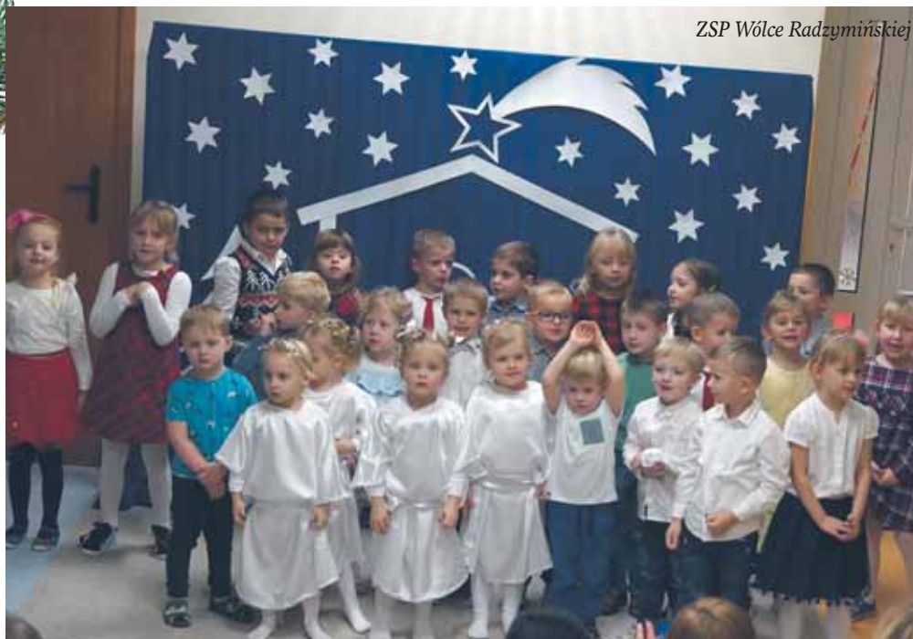
ZSP Wólce Radzywińskiej

Jasełka mają długą tradycję. Są to widowiska o Bożym Narodzeniu wzorowane na średniowiecznych misteriach, a ich nazwa wywodzi się od staropolskiego słowa jasoł oznaczającego żłób. Do największych ulicznych jasełek na świecie zaliczany jest Orszak Trzech Króli. Trudno nam sobie wyobrazić okres poprzedzający Święta Bożego Narodzenia bez tych przedstawień. Zapraszamy do obejrzenia fotorelacji z jasełek w gminnych szkołach.