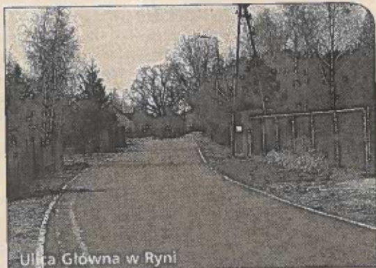
Ulica Główna w Ryni

W tym roku przez tę samą firmę wybudowane zostało kolejne 512 metrów ulicy. Na przyszły rok czeka, może już ostatni, 700-metrowy odcinek. Do tej pory łącznie wydano ponad 262 tysiące złotych.