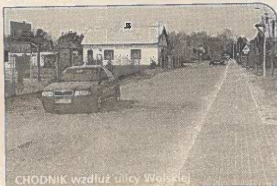
CHODNIK wzdłuż ulicy Wolskiej

tu i budowę pierwszego etapu chodnika wydane zostało około 50 tysięcy złotych. Dalsza budowa przewidziana jest do realizacji ze środków powiatowych. Aktualnie w Starostwie Powiatowym trwa przygotowania do kontynuacji inwestycji.