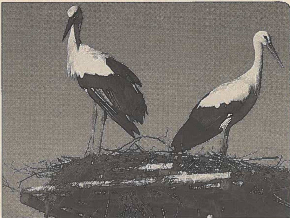
WIELE GNIAZD BOCIANY założyły na nieużytkowanych kominach szklarniowych i od wielu lat tam gniazdują

Przeprowadzone w tym roku liczenia bocianów pozwolą ocenić