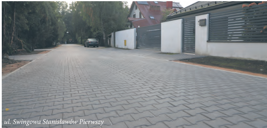
ul. Swingowa Stanisławów Pierwszy