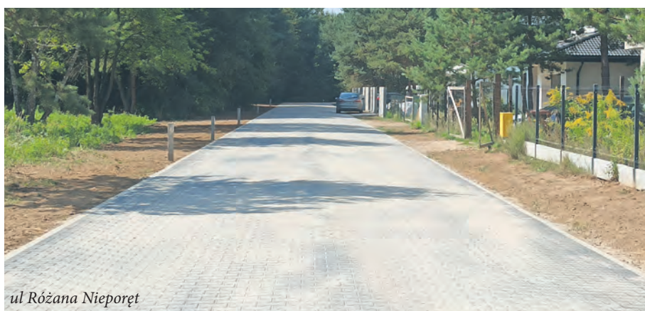
ul. Różana Nieporęt