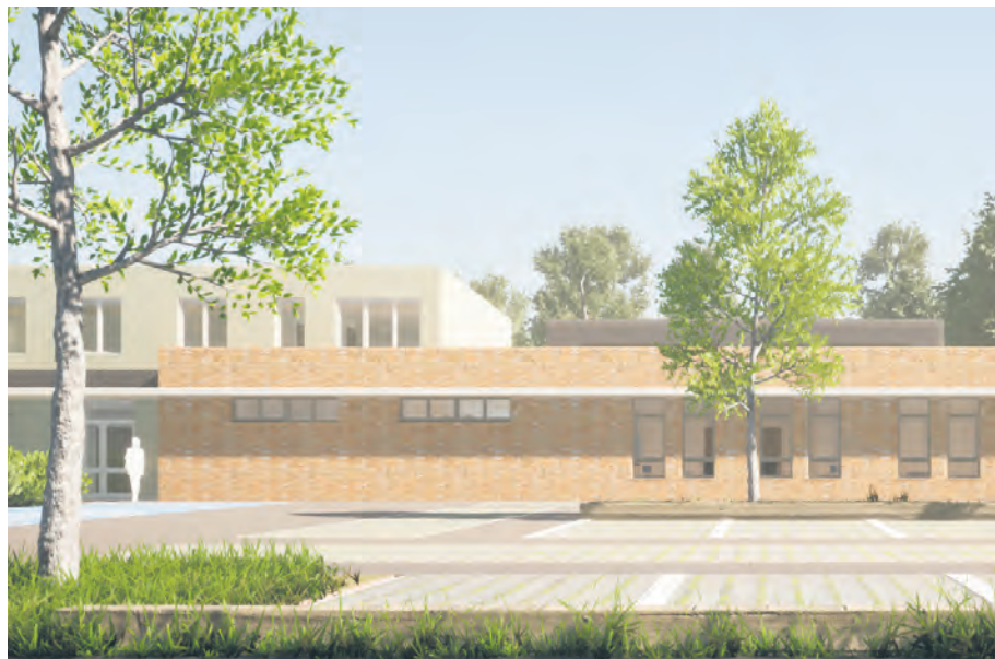
Wizualizacja przychodni rehabilitacyjnej

również zamówienie na zakup wyposażenia medycznego. Planowane zakończenie budowy to kwiecień 2024 r.