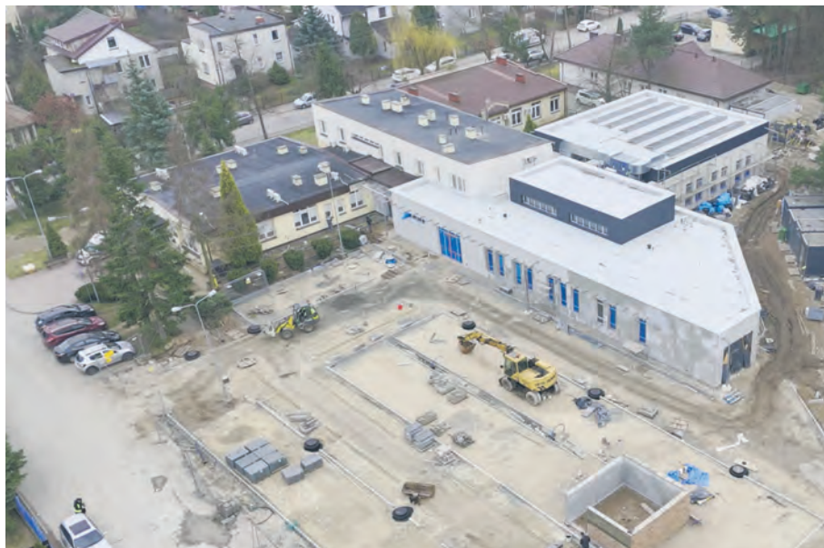
Zdjęcie z lutego 2024 r.