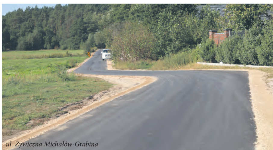
ul. Żywiczna Michałów-Grabina