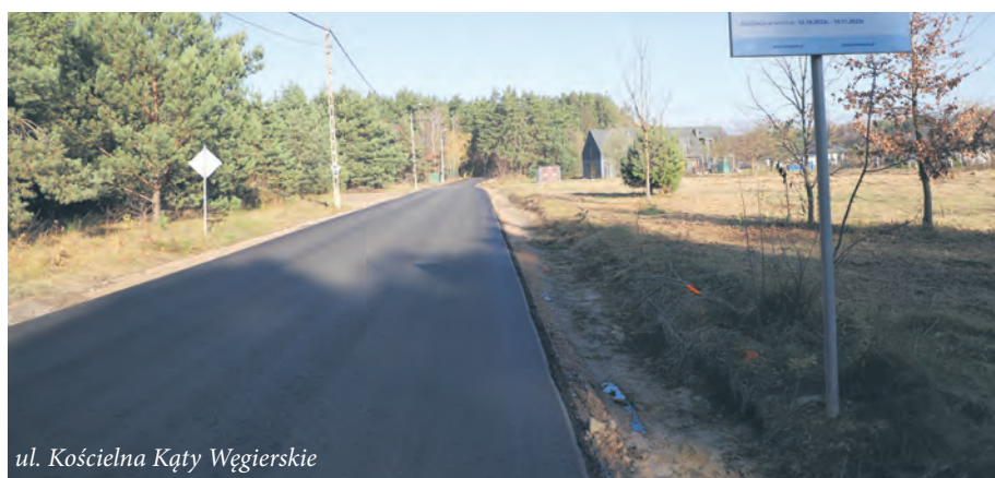
ul. Kościelna Kąty Węgierskie