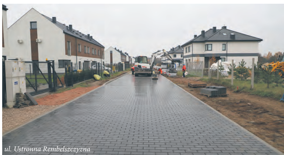
ul. Ustronna Rembelszczyzna