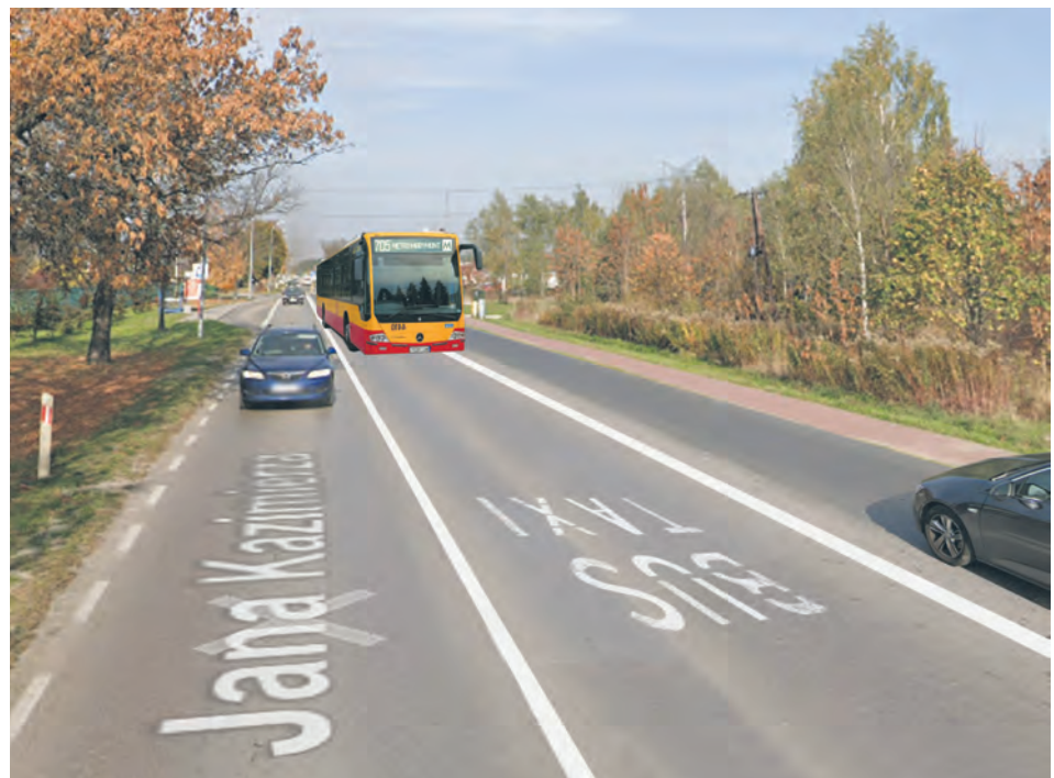
Wizualizacja buspasa na ul. Jana Kazimierza UGN