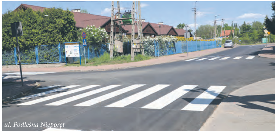
ul. Podleśna Nieporęt