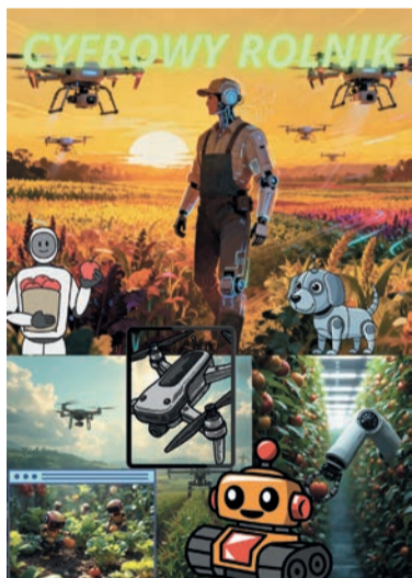
I miejsce – Maja Smakosz, klasa 5, SP im. Wojska Polskiego w Białobrzegach