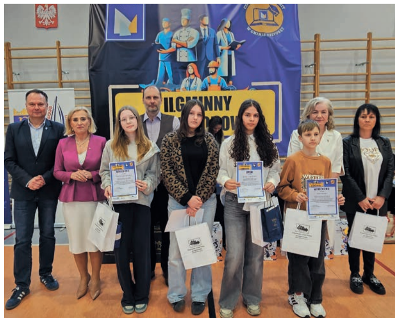
Laureaci konkursu w kategorii projekt