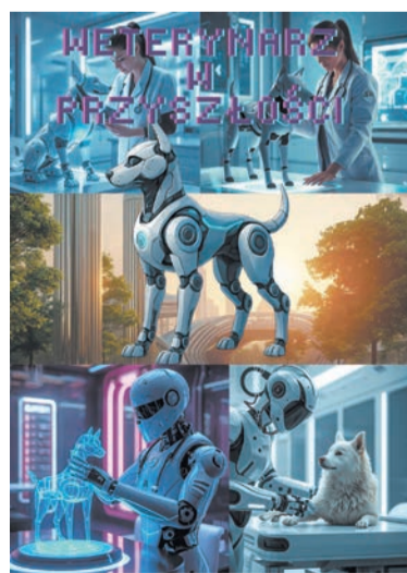
Wyróżnienie – Pola Borkowska, klasa 5a, im. Wandy Chotomskiej w Józefowie