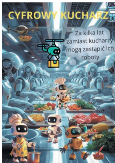
III miejsce – Zofia Olszewska klasa 5, SP im. Wojska Polskiego w Białobrzegach