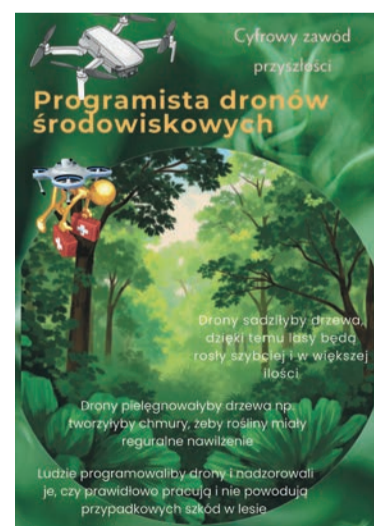
Wyróżnienie – Alicja Mańk, SP im. I Batalionu Saperów Kościuszkowskich w Izabelinie